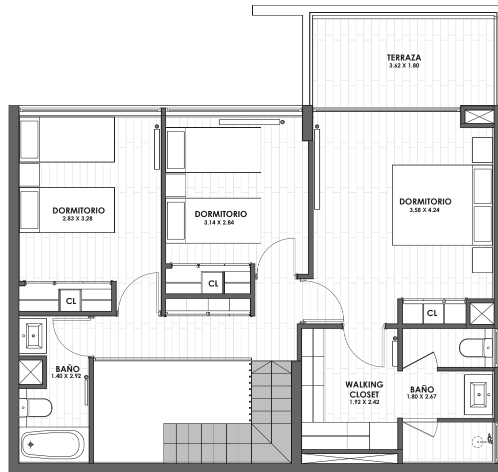
NIVELES SUPERIORES (PISO 3º Y 5º)

Nota: * Las dimensiones indicadas son referenciales a obra gruesa y medidos a los recintos preponderantes